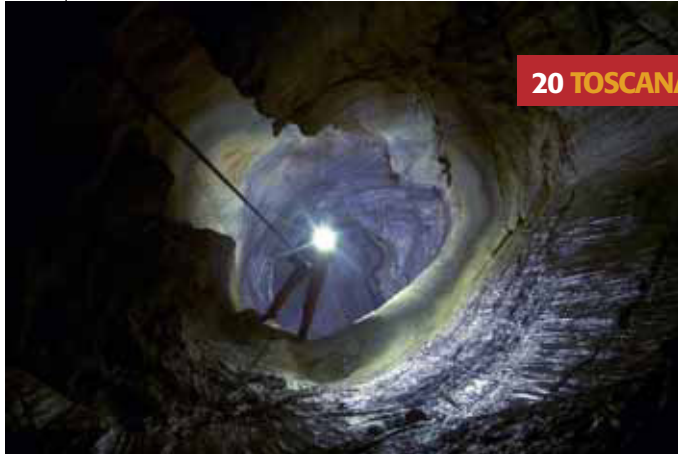
20 TOSCANA Gigi Squisio