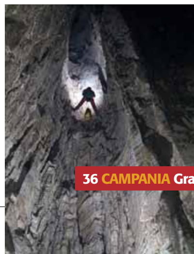
36 CAMPANIA Grava del Campo