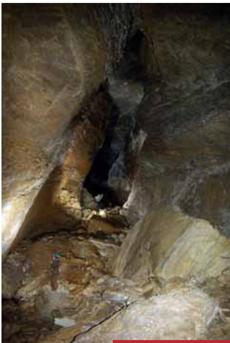
27 TOSCANA Chimera